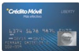
Crédito Móvil Liberty

El seguimiento de las normas de seguridad que se enuncian a continuación garantizarán una correcta Operatoria y evitarán cualquier intento de fraude con Tarjetas de Crédito.